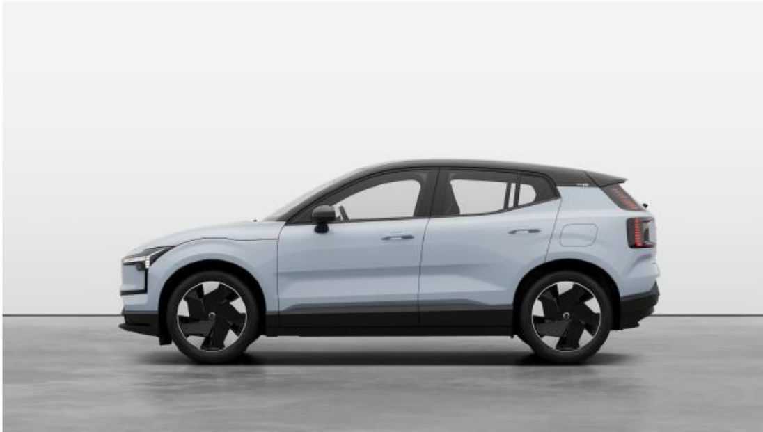
EX30 Wygląd zewnętrzny